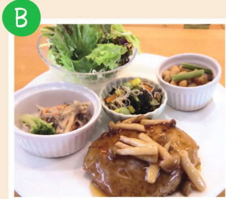
豆腐ハンバーグプレート 〔和風煮込み〕