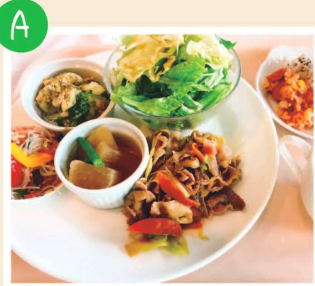
おまかせ健康プレート 〔本日のメイン料理〕